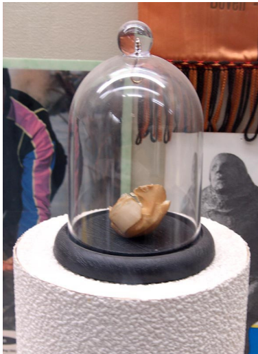
De teen van Tinus Udding is zo te bezichtigen in het Eerste Friese Schaatsmuseum

gegroeid. In het donker konden de rijders dan verdwalen op de uitgestrekte meren. Daarom is besloten de route andersom te gaan rijden, zodat ze met de opkomende zon in de rug de meren passeren en 's avonds in het donker op de vaarten schaatsen. " Documentatie over de geschiedenis en alle verreden tochten is er dan ook genoeg aanwezig.